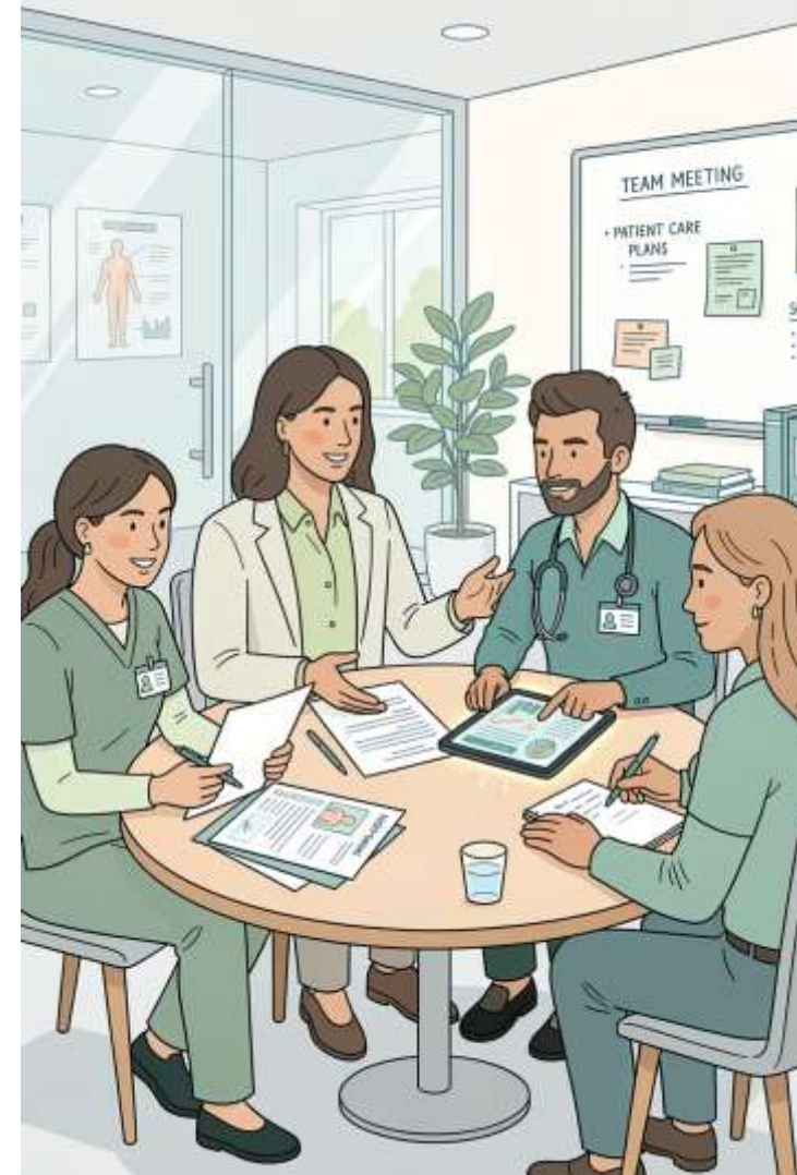
Table ronde RONDELET - Auditorium 3 – 21 mai 2026 11h30